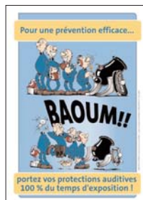
Affiche de sensibilisation