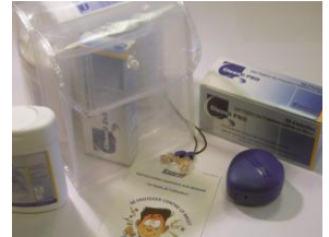
Reinigungssets: um die Wirksamkeit der Gehörschützer zu wahren