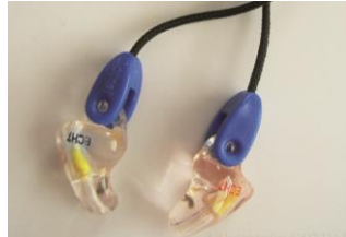
Gehörschutz COTRAL MICRA 3D: Diskretion in 3 Dimensionen (3D-Herstellungungsverfahren)