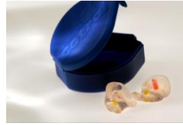
Gehörschutz COTRAL Ultra mini: Diskret und unauffällig