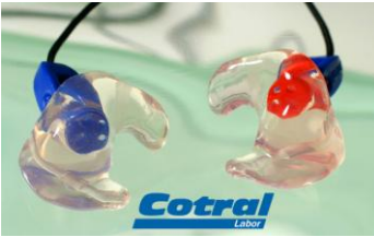
Gehörschutz COTRAL Premium: 8 akustische Filter (CE-zertifiziert), 5 Jahre Garantie

... um 100% der Lärmexpositionszeit getragen zu werden